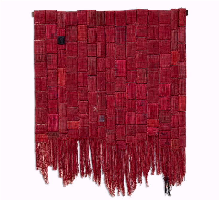
Au-dessus. Ange Dakouo. Impulsion collective , 2024. Carton, journaux, fil de coton et acrylique. 115x95 cm. Courtesy de la galerie AFIKARIS et de l'artiste.

« COMME CHAPLIN, JE CROIS QUE NOUS AVONS LE POUVOIR DE TRANSFORMER NOTRE MONDE. CHAQUE POINT DE TISSAGE, CHAQUE TRAIT DE PINCEAU, CHAQUE NOTE DE MUSIQUE, CHAQUE MOT ÉCRIT PEUT DEVENIR UNE EXPRESSION DE CETTE LUTTE CONTRE L'INDIFFÉRENCE. ENSEMBLE, EN TANT QUE RÊVEURS, NOUS POUVONS ÉRIGER UNE SOCIÉTÉ OÙ L'AMOUR ET LA SOLIDARITÉ SONT LES LUMIÈRES QUI GUIDENT NOTRE HUMANITÉ VERS UN AVENIR PLUS LUMINEUX ET PLUS UNIFIÉ. »