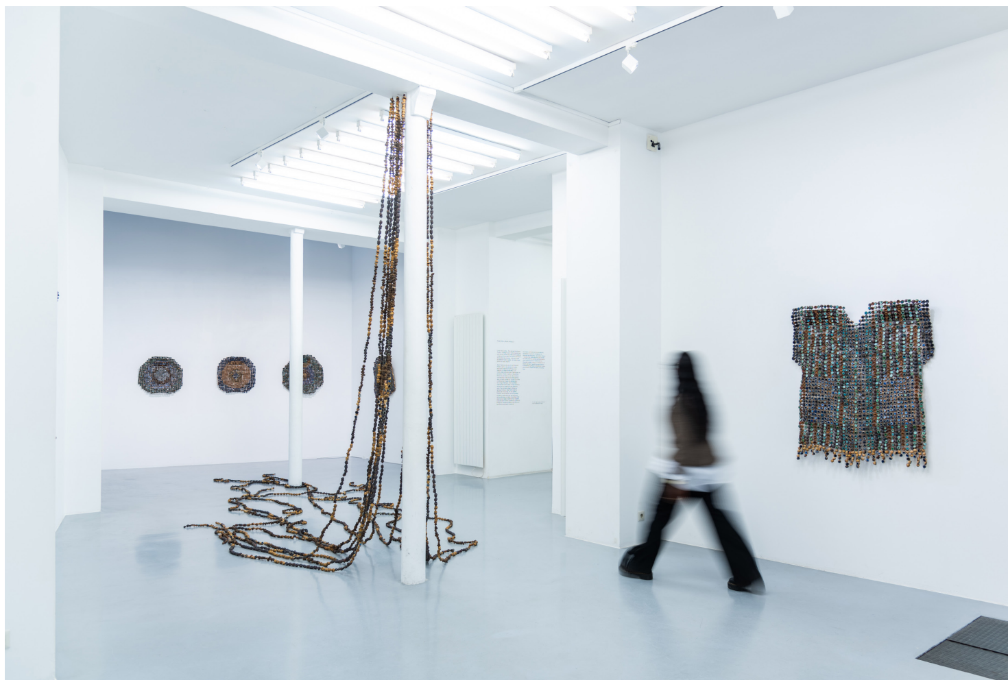
Au-dessus. Vue de la galerie AFIKARIS située au 7 rue Notre-Dame-de-Nazareth.

Le programme d'AFIKARIS comprend des expositions collectives et individuelles, des foires d'art, des publications, une résidence artistique ainsi que des partenariats institutionnels.