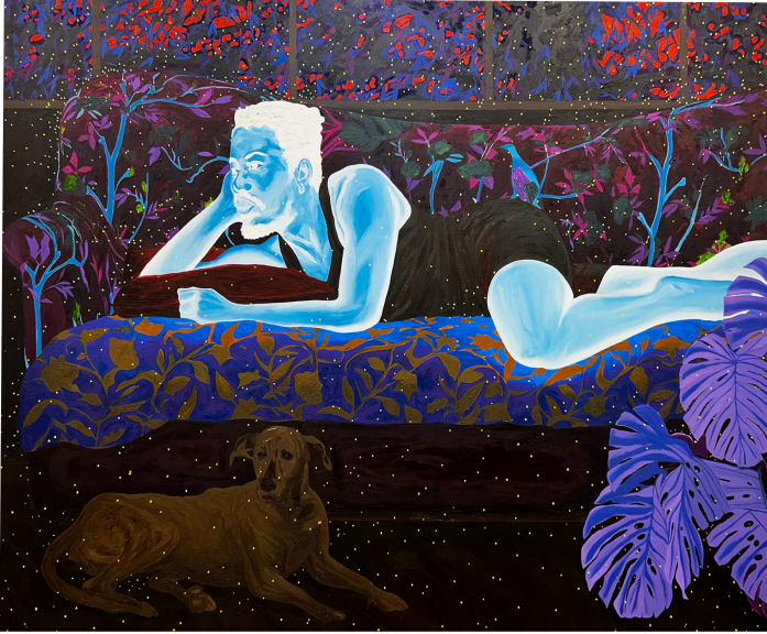
Boluwatife Oyediran. David on a Couch , 2024. Huile et acrylique sur toile. 183x244 cm

INVERTED BLACKNESS Boluwatife Oyediran 17 octobre – 23 novembre